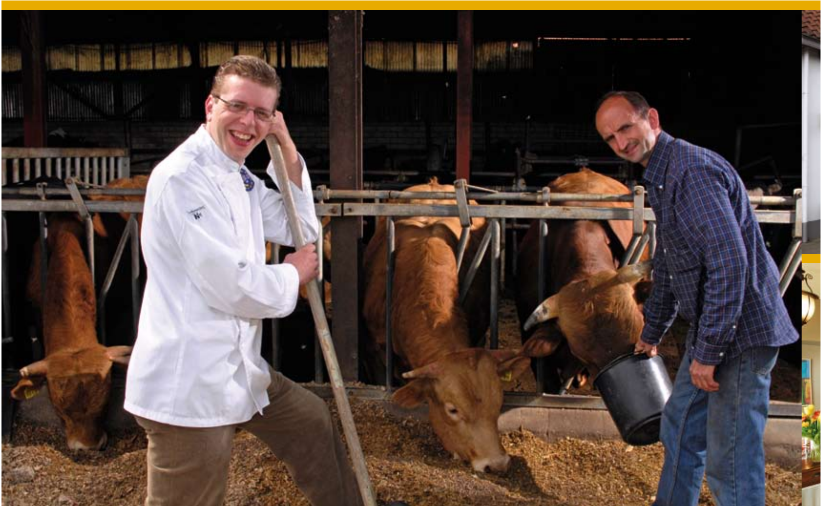
"We staan echt achter onze producten. Die zijn authentiek en geven een eerlijk gevoel."

>>> nicator van het inmiddels jaarlijks terugkerende Streekfestival. "Het doel, de kleine producenten, consumenten, winkels en horeca bij elkaar brengen lijkt een groot succes."