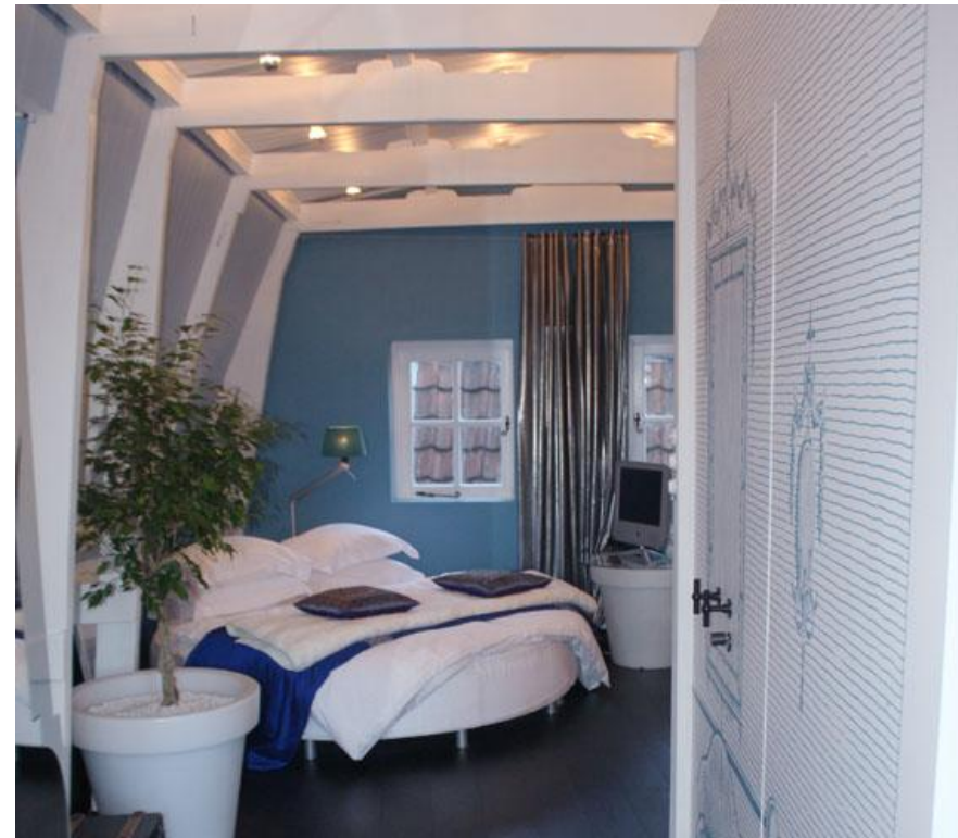
Foto: blauwe kamer B&B 'Kamer01 - Amsterdam'

Een B&B met meer dan 2 kamers en 5 slaapplekken moet voor de wet wel ingeschreven zijn bij het Bedrijfschap Horeca en Catering.